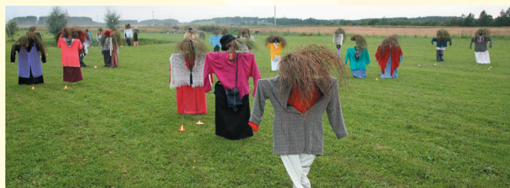
Lasva järve muusikaõhtu eel otsustas Pässä küla rahvas küla hernetontide ehk pässudega elavamaks muuta.